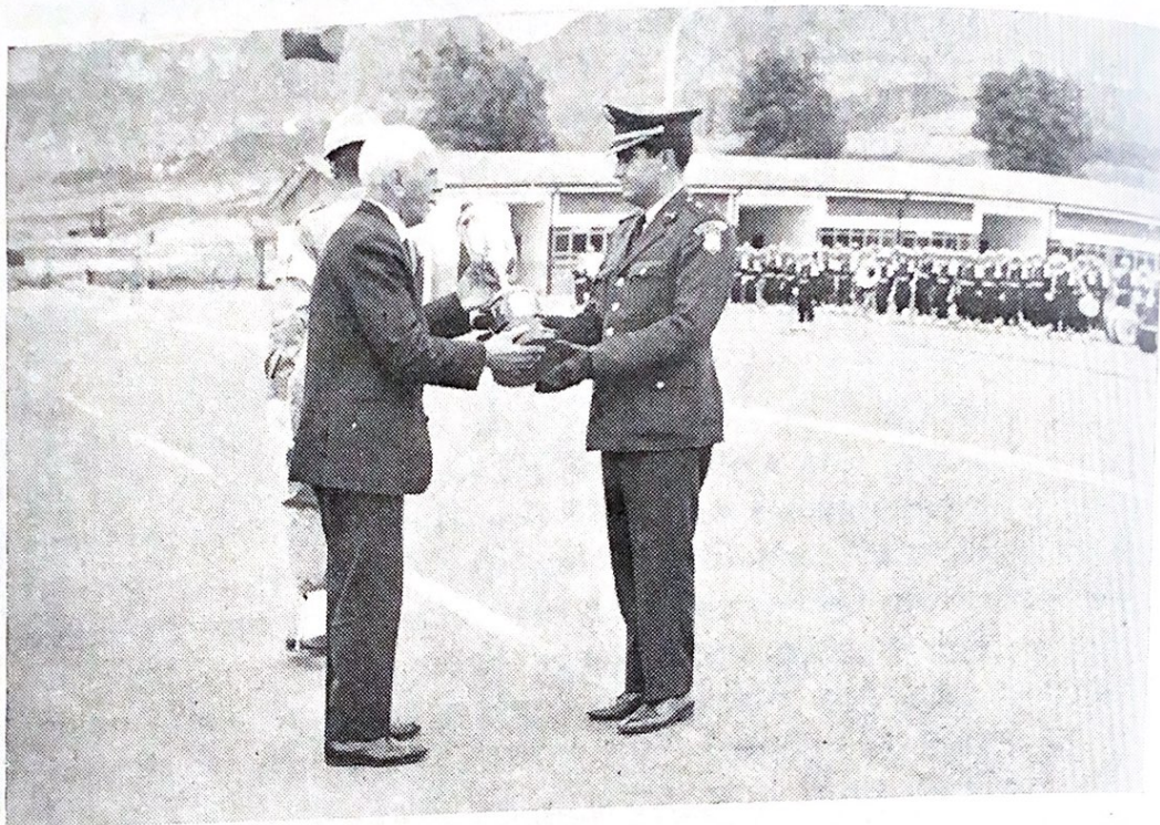
“El señor General Domingo Espinel, Comandante del Grupo, hace entrega de la “Copa Santa Bárbara”, al Oficial que ocupó el Primer Puesto en la Escuela de Artillería”.

En Noviembre de 1963 y con motivo de la clausura del Curso de Tenientes aspirantes a Capitanes, tuvo lugar, por primera vez la entrega de la “Copa Santa Bárbara”.