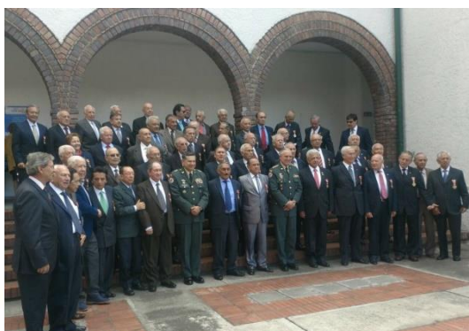
Entrega No. 26