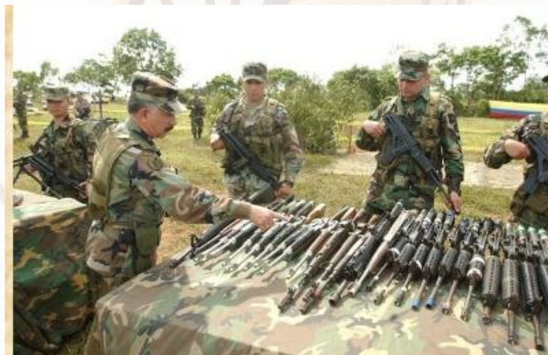
Foto. General Reinaldo Castellanos en Operación Libertad I. Junio-Diciembre del 2003.

La Operación Libertad 1, se realizó el 6 de junio de 2003 contra las estructuras criminales de las FARC en el marco del Plan Patriota, adscrito a la Política de Seguridad Democrática, la cual tuvo como objetivo principal el departamento de Cundinamarca.