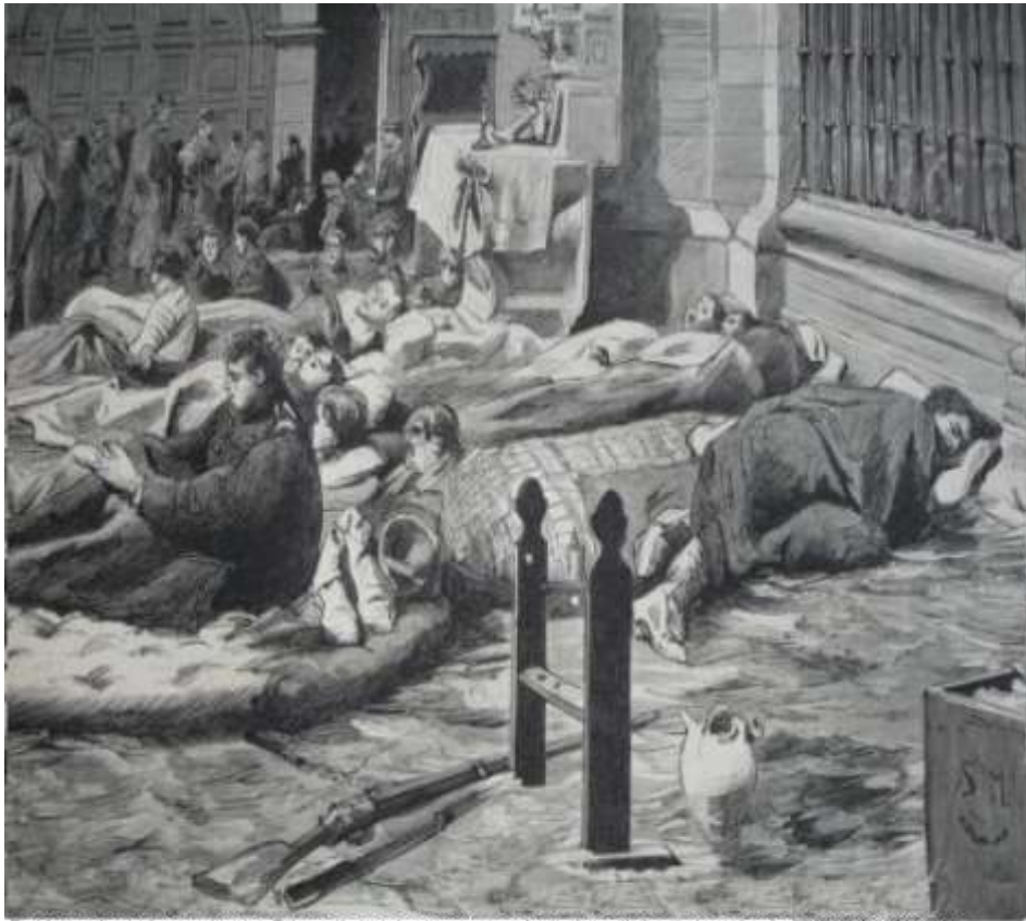
En Valencia se improvisaron 5 hospitales de sangre, es decir, hospitales improvisados para atender a los heridos de un combate. ( Casa de La Estrella, el Hospital de San Antonio de Padua, el Convento de San Buenaventura, la casa de los Celis y dos casas más)