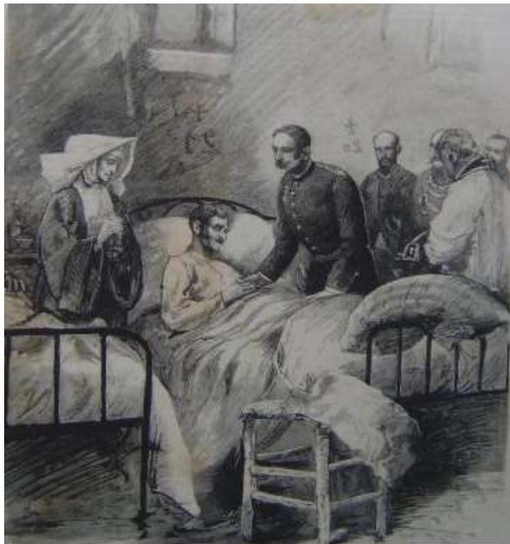
Ferriar gravemente herido fue trasladado a Valencia y hospitalizado en uno de los hospitales de sangre y fallece el 17 de julio, es decir tres semanas después de la batalla

En conclusión: fueron tres los oficiales de artillería que, como mercenarios, hicieron parte de los ejércitos patriotas a partir de 1817. Como artilleros, mostraron un comportamiento responsable, de valor y de militares honorables, aunque su aporte en armas y en técnicas de artillería no se vio, por cuanto la artillería fue la gran ausente en los ejércitos de Simón Bolívar