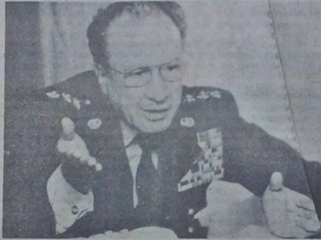
General Fernando Landazábal Reyes

—A la Policía le vamos a aplicar unas modificaciones, siguiendo un procedimiento perfectamente claro y perfectamente planeado. Primero vamos a darle fuerza institucional. La Policía es una institución muy res-