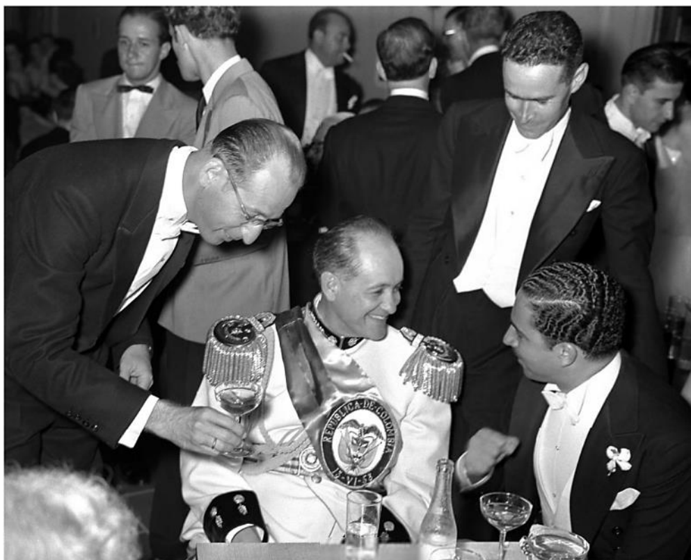
Presidente Gustavo Rojas Pinilla. Medellín, 1953

de noviembre de 1949 ante la iniciativa de los liberales de promoverle un juicio por la Violencia. 7